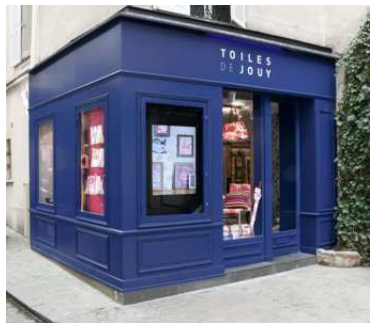
■ Boutiques de Toiles de Jouy, 24, rue de Passy, Paris (XVI e ). Tél. 01.45.25.25.21.