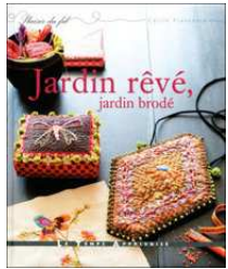
JARDIN RÊVÉ, JARDIN BRODÉ, DE CÉCILE FRANCONIE , Ed. le Temps Apprivoisé, 120 pages, 23,50 €.